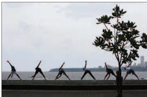
FELLESTRIM: Arabiahavet er den nordvestlige del av Det indiske hav. Her har noen menn samlet seg for å trene ved vannkanten.