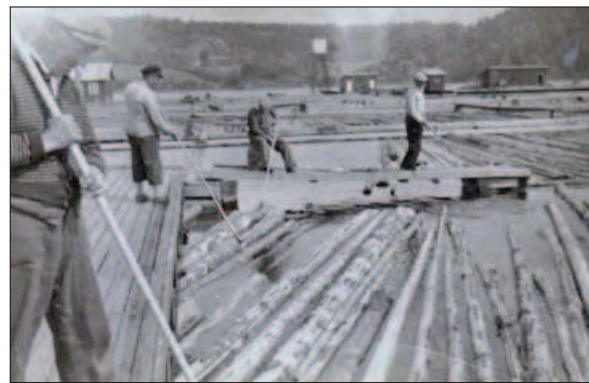
GÆRNINGER: Fire lensekræbber kontrollerer de sorterte tømmerstokkene. Feilsorterte stokker, som ble kalt «gærninger», ble dratt ut herfra og sortert på nytt.