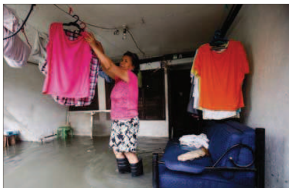
FLOMKATASTROFE: I Manila omkom flere personer i forbindelse med flom. Her henger en husmor tøy til tork, mens hun vasser i vann.

1985 fløt den siste tømmerstokken gjennom lenseanleggene. I Sarpsborg er det ennå mange spor etter det gamle yrket, og etter å ha lest Agnalts artikkel dukker uunnngåelig spørsmålet om Sarpsborg har gjort nok for å bevare sin rike historie fra tømmerfløtingen. Sporene i våre kommuner er mange.