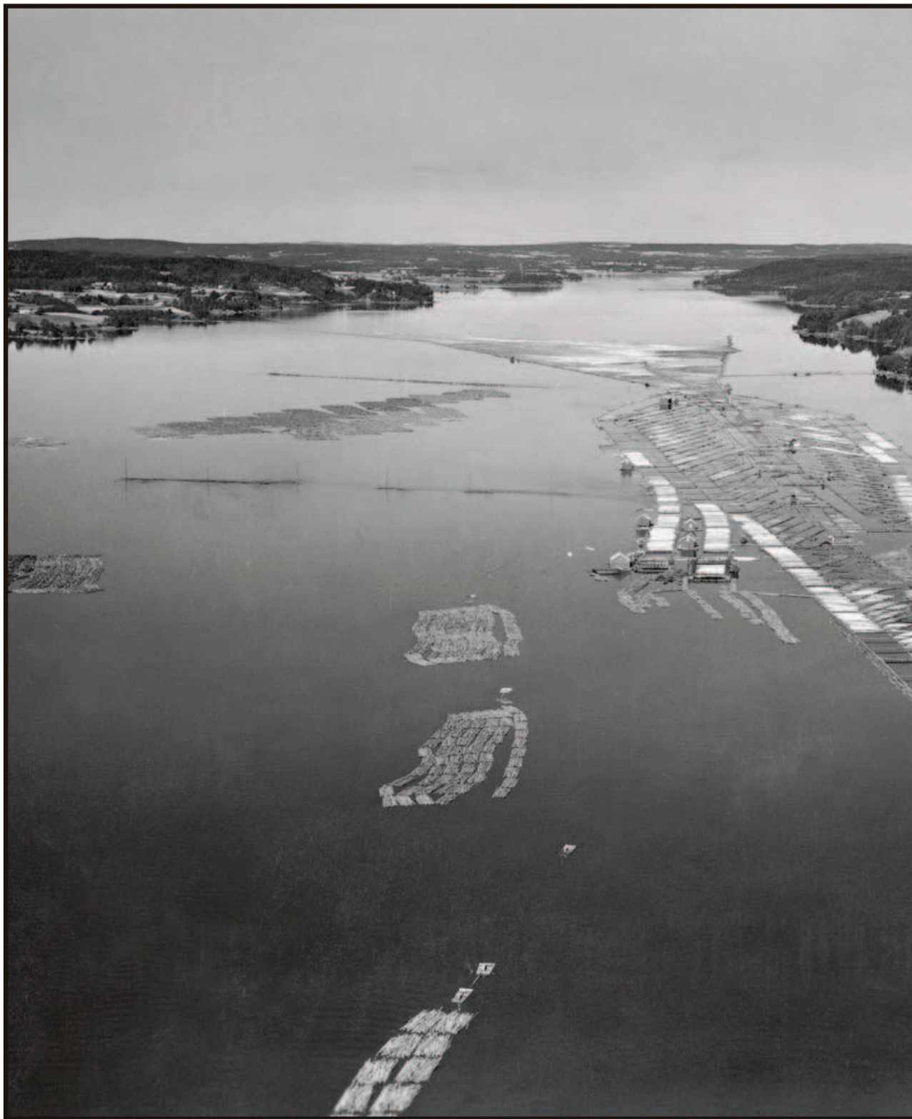
LOKAL LENSE: Glennetangen lense i Varteig ved Sarpsborg, fotografert fra luften i 1951. Glomma er fotografert fra sør, på høyre side av elva ligger Varteig og Rakkestad, på venstre side skimtes Skiptvet. Lensa var sorteringsanlegg for tømmeret og var tre kilometer lang.

Dermed fikk færre arbeidere jobb med vedlikehold på lensa mellom fløtingssesongene. Dette