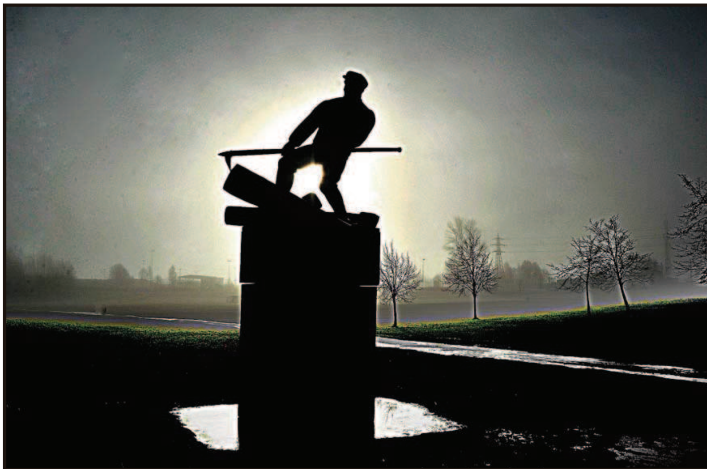
TØMMERFLØTEREN: Skulpturen av Tømmerfløteren, som står i Glengshølen, viser tydelig at arbeidet med tømmerstokkene var et tungt kroppsarbeid.

Dette var også tilfellet på Glennetangen, hvor fløterhaken var ganske lik fløterhaken fra Drammen. I motsetning til Fetsundhaken, hadde fløterhaken på Glennetangen en utforming som gjorde den nyttig i arbeidet med å bunte tømmerstokkene sammen. Et innsøkk i stålet gjorde at arbeiderne kunne dra vaieren, som lå i vannet under tømmerstokkene, opp med fløterhaken. Ifølge lensekræbbene var dette en veldig fordel i forhold til den fløterhaken som ble brukt på Fetsund lense.