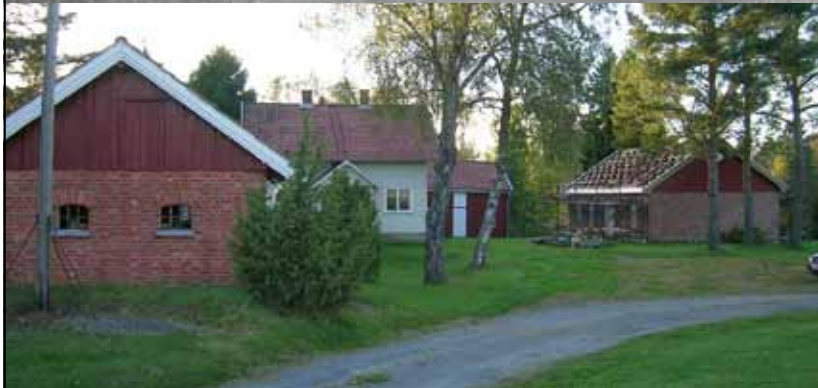
Meieri-eiendommen, slik den framstår i dag. Vi ser fra venstre grisehuset, boligen, uthuset og meieribygningen.