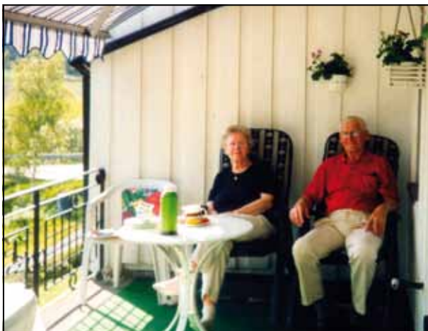
Kaffekos i solen på Sigtun i mai 1998.