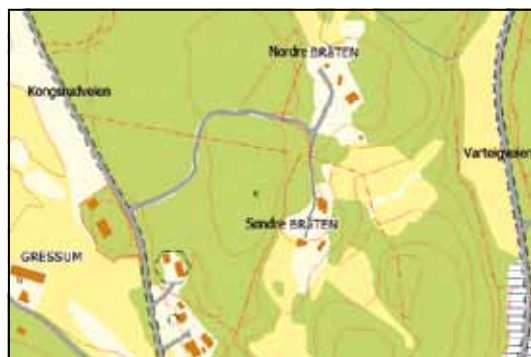
Kartutsnitt som viser Søndre og Nordre Bråten, der plassene ligger mellom Varteigveien og Kongsrudveien.