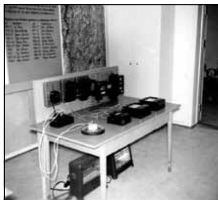
En del av Varteig El-verks utstilling.