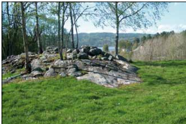
Epletrær, spor etter jordkjeller og noen biter av teglsten er det som er igjen av boplassen som lå på Fauli.

De var på plassen et års tid før de i 1917 flyttet til Skiptvet. Rundt 1920 ble våningshuset på Sinkerud gjenreist som bryggerhus på Gressum, og her bodde familien Handelsby i noen år da de i 1931 kom tilbake til Varteig (se Inga 1988).