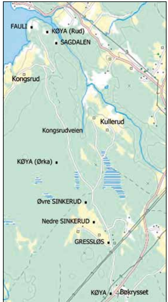
Kart som viser de tidligere boplassene fra Bøkrisset til Grytebrua – med Køya ved Bøkrisset, husmannsplassen ved Gressløs, Øvre Sinkerud, Nedre Sinkerud, Køya under Ørka, Sagdalen, Køya under Kongsrud og Fauli.

Vår anbefalte tur – som nok bør skje til fots framfor i bil – starter på Køya ved Bøkrisset, i krysset