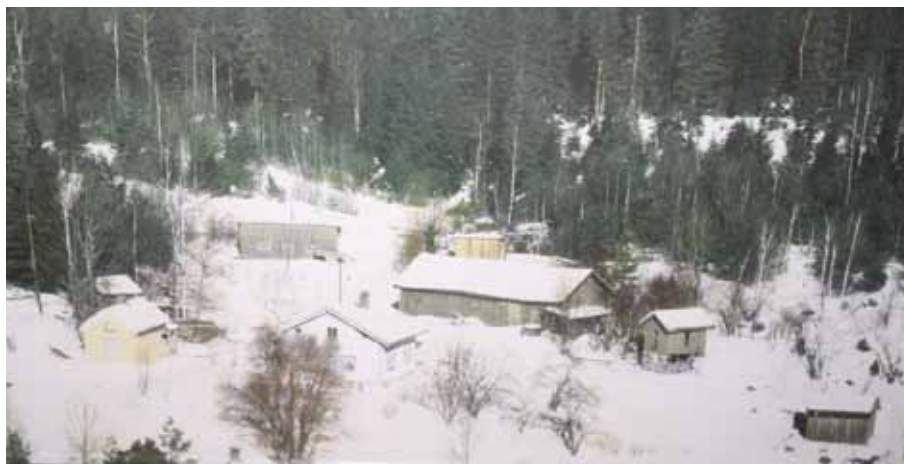
Flyfoto av Nordre Bråten, trolig tatt på 1960-tallet. Nå er både låve, hovedbygning og bryggerhus borte, og ny bolig er reist øst for låven.