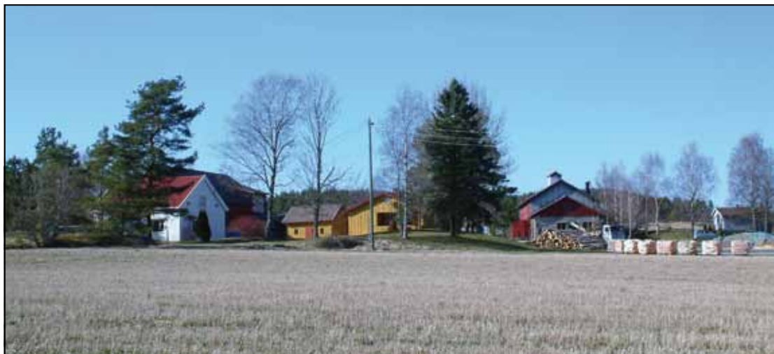
BRUSEVOLD Nordre våren 2010