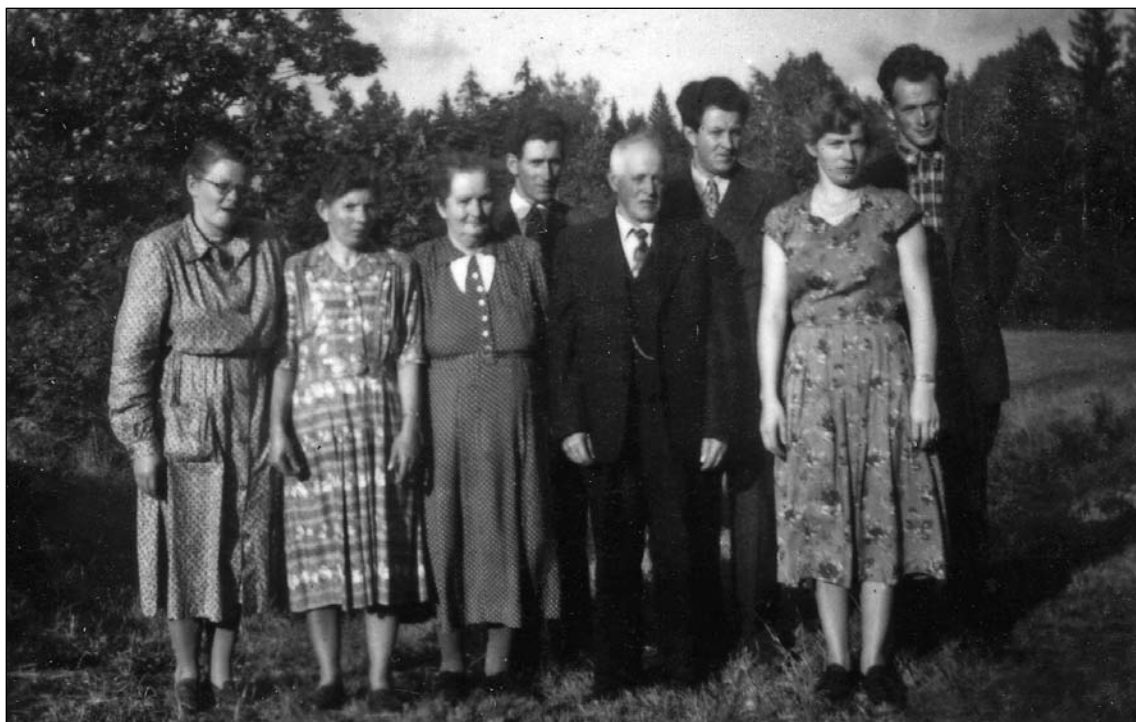
Familiebilde fra Brusevolddalen, gnr 3037, bnr 2, 8

I hagen på Brusevolddalen ca 1955 ser vi foreldre med sine voksne barn: