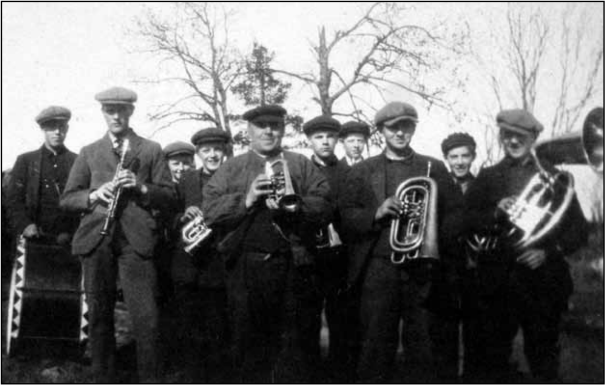
BERGERUDMUSIKKEN ca 1924